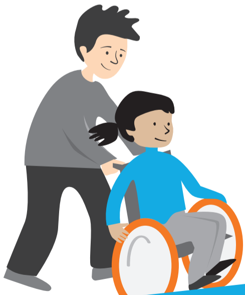
Besondere Fürsorge und Förderung bei Behinderung