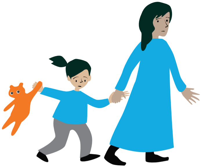
Schutz im Krieg und auf der Flucht