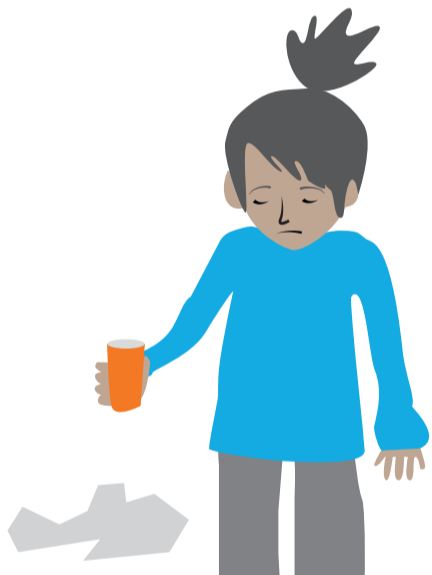
Schutz vor Ausbeutung