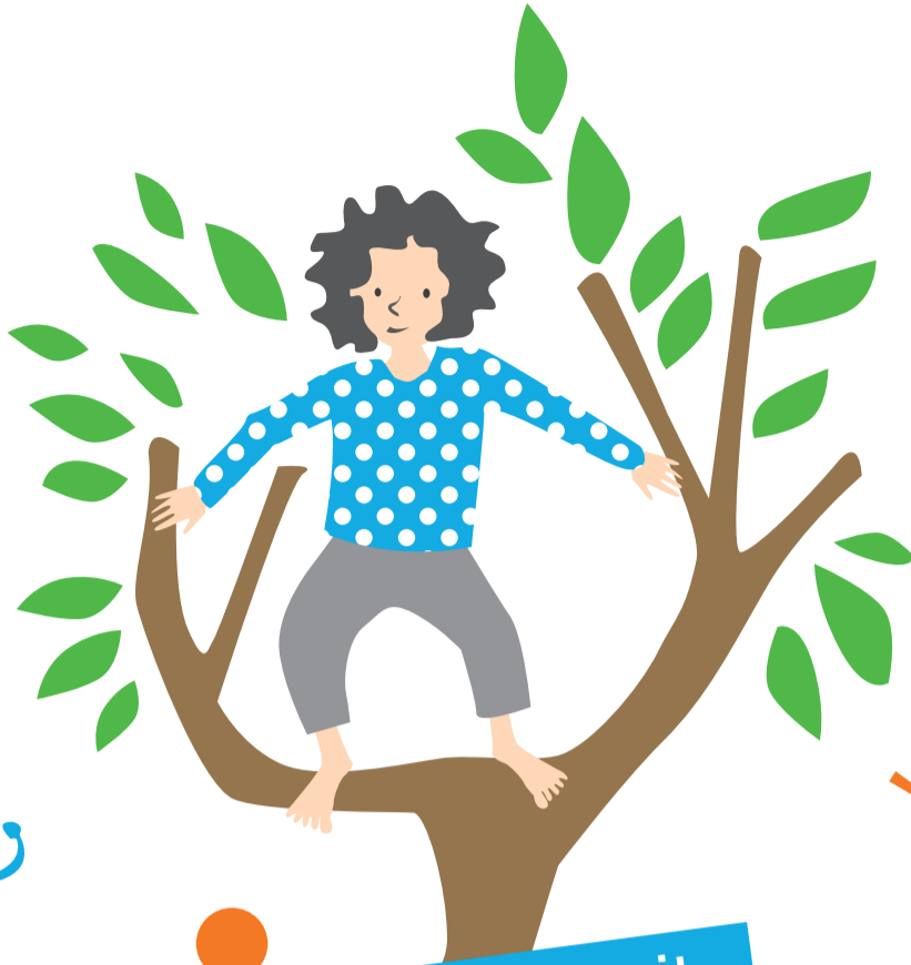
Spiel und Freizeit